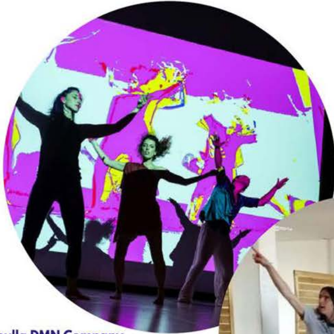
Zappulla DMN Company