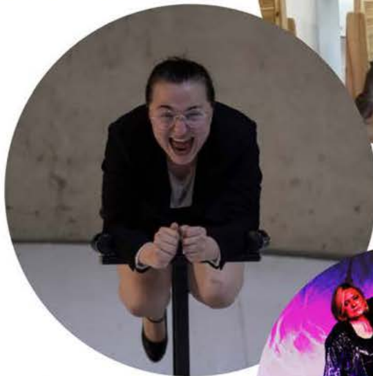
Cie Karine Ponties