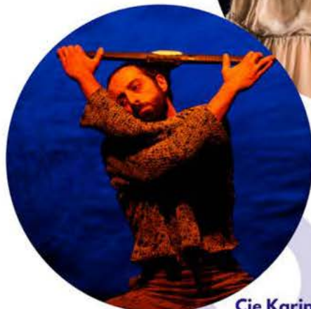
Cie Karine Ponties