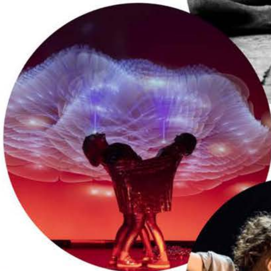
HOTELOKO movement makers