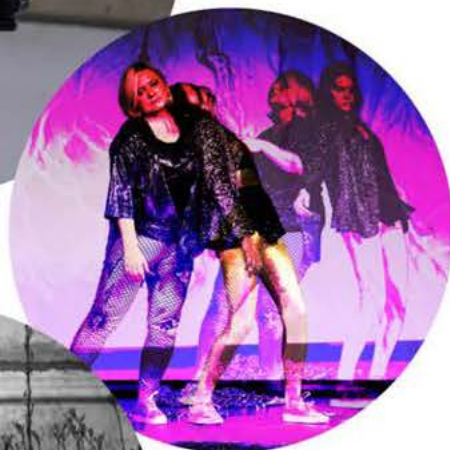
HOTELOKO movement makers