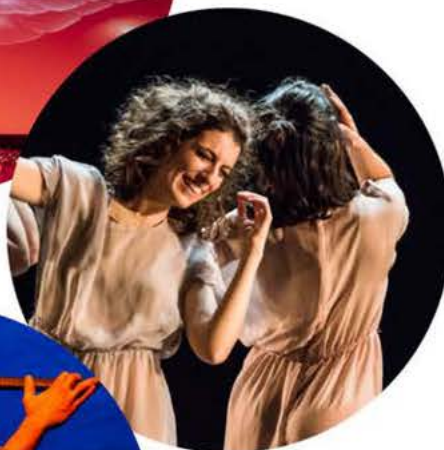
Zappulla DMN Company Photo: l'espace